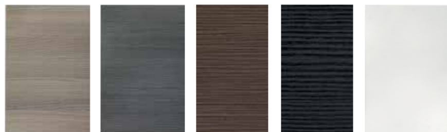
AKAASIA ANTRASIITTI MOKKA PUUSYY MUSTA PUUSYY VALKOINEN Kuulto