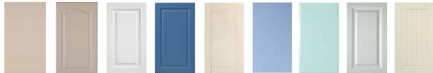
AARIA Kaakao Lakattu CRESENDO Kaakao DUURI Valkoinen HARMONIA Sininen LYYRA Kerma FAGOTTI Jäänsininen TUUBA Valkoinen maalattu TENORI B Vihreä LYYRA URA Vanilja