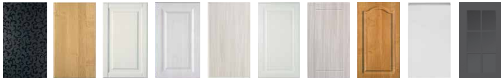
AARIA Musta Deco TUUBA Leppä-kalvo BASSO Jasmin-kalvo TENORI B Harmaa FAGOTTI Valkotammi HARMONIA Valkoinen, Puusyy-kalvo LYYRA Valkotammi CRESENDO S Leppä PIANO Valkoinen Kiiltävä DUURI Ristikko